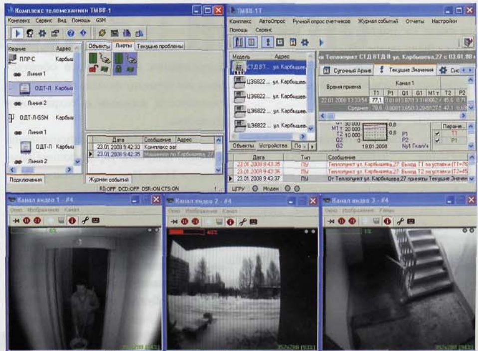
Рис. 2. Экран оператора комплекса TM88-1

- ПО TM88-1, обеспечивающее диспетчеризацию лифтов и другого инженерного оборудования зданий (управление освещением, сигнализация) по